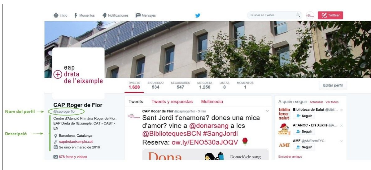
* Figura 1: Descripció pàgina de perfil.

També són importants tant la imatge del perfil (normalment seria el logo del nostre centre), com la nostra descripció, on posem qui som, on som, els idiomes en què podem publicar els nostres tuits i, si en tenim, la nostra pàgina web. (Fig. 1).