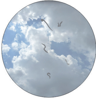
Flóculos vítreos tal y como los percibe la persona