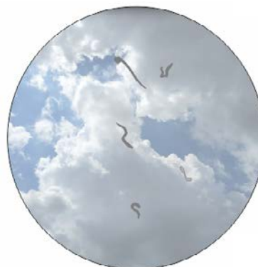
Flòculs vitris tal com els percep la persona