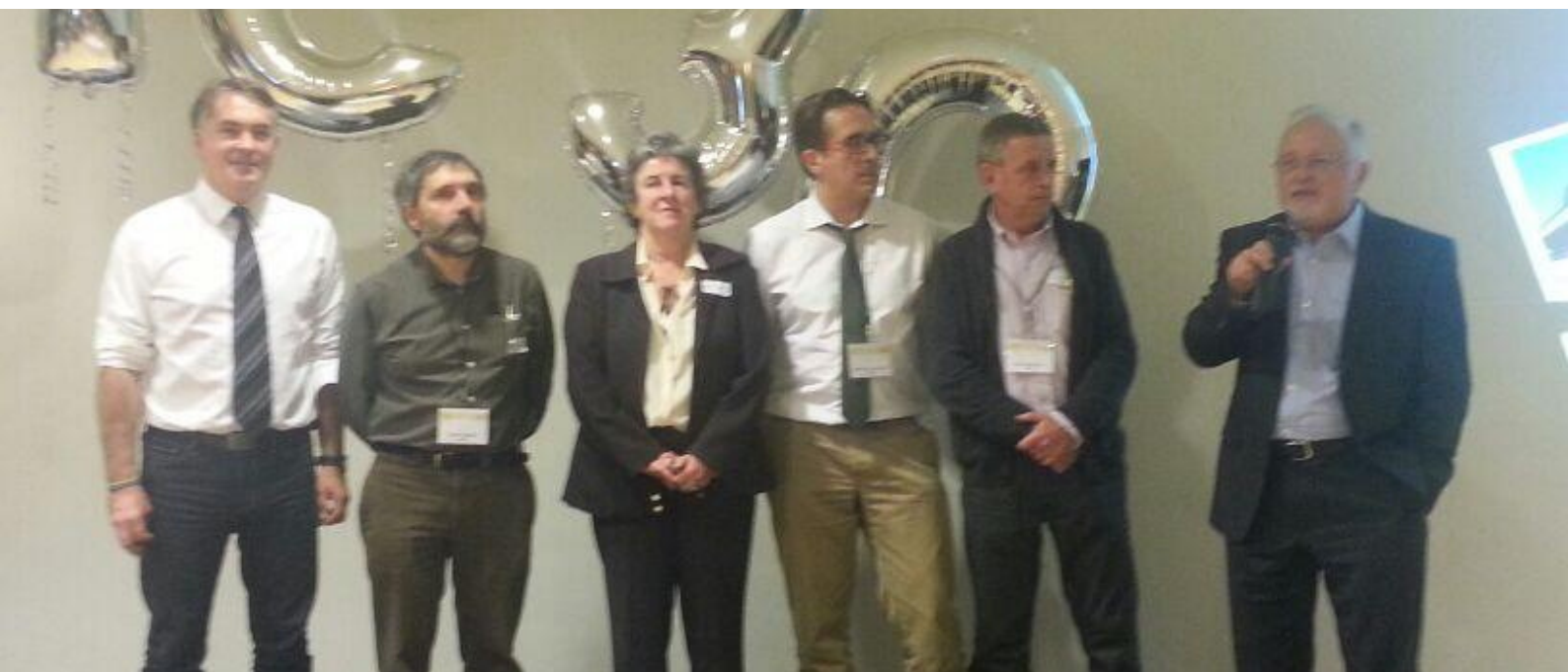
presidents CAMFiC a la festa dels 30 anys de la societat

A més, la Societat atorga des de l'any 1997 el Premi de la Comissió de Cooperació i Salut Internacional 0.7%. De fet, la Societat va ser pionera al dedicar el 0.7% dels seus ingressos anuals al finançament